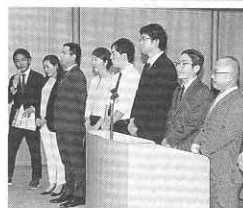
部員募集のリーフレットと活動を担当する組織・強化変革委員会のみなさん