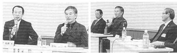
野澤会長代行や参加者からの問い掛けに応える定岡(右)、篠塚(左)の両氏

研修会スケジュールでは、元読売巨人軍の定岡正二(61歳)、篠塚和典(60歳)の両氏による「気まぐれトーク」が行われ、野球界という異業種からの苦労話などを通して、組合運営のヒントを探った。定岡氏はドラフト第一位指名で巨人軍に入団し、1982年には15勝を挙げ、日本一に貢献した名ピッチャー。同じく篠塚氏もドラフト一位で入団し、巧打の内野手として注目を集めた選手。