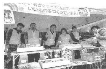
チャレンジャー(障害者)の手作り商品を販売