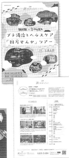
ツアー案内チラシ