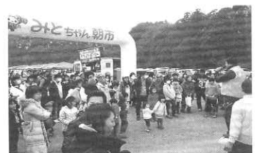
朝市のような様子

障害者への日当はピンゴカードの収益や売上の中から支払い、少ないながらも障害者就労支援施設への寄付も行っている。来場者は開始時の10倍に増え、売り上げは目標額に向け着実に伸びているというが、「何より、就労支援施設の生産品の完売、来場者の障害者への理解、そして障害者の積極性ある声の大きさと多くなった笑顔の回数が最大の成果です」と組合の水戸支部のみなさんは語っている。