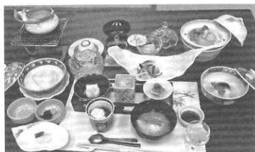
タニタと共同開発したヘルシー懐石料理の一例

同協会では「ヘルスツーリズムは、全国的に認知度は低く集客には苦戦している。しかし昨今の健康志向ブームや健康寿命延伸というテーマは、今後必ず観光業にも波及してくるでしょう。まだはじめばかりの手探りの状況だが、成功事例として群馬県また県外へもこの取り組み内容が共有できるよう取り組んでいきたい」と熱い意気込みを見せている。