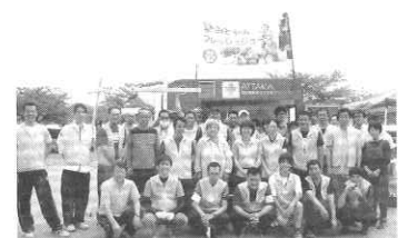
「みとちゃん朝市」のスタッフのみなさん