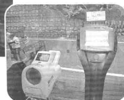
四万温泉協会に設置してある体組成計と血圧計