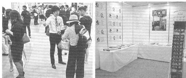
スパ展の様子と全旅連のシルバースター PRブース

「訪日外国人観光客数は昨年2400万人超となり、今年もその勢いは止まらないが、目標は2020年4000万人、2030年6000万人で、観光立国化はGDP600兆円の有力な手段とされている。地域では、地域に眠る資源の活性化計画が急速に進み、それは異分野も横串にして、『観光』+『健康』『美容』、『観光』+『ス