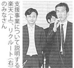
支援事業について説明する楽天（上）、リクルート（右）のみなさん

保健所など）による連絡協議会の立ち上げ、世論に訴える活動となる街頭での署名活動の各地域での展開（集めた署名簿は自治体の首長や議長に手渡す場合、事前にマスコミにプレスリリースして取材してもらう）などが挙げられる。