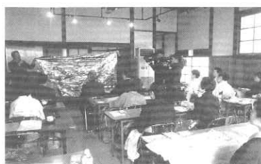
完成報告会の様子 メディアの関心も高くテレビ局3社の取材があった

おかみの会では「キットを活用し、宿泊客の安心、安全に配慮した営業を続け、宿泊防災に備える静岡県を女将の立場から推進していきたい」としている。