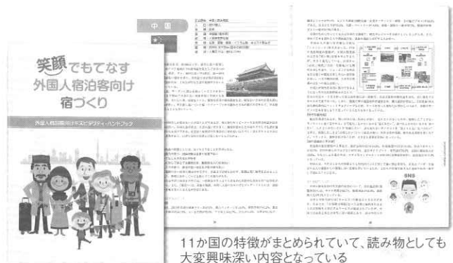
ハンドブック表紙

ハンドブック活用法のための研修会では、今まで受け入れに消極的だった経営者も受け入れてみようという考えになってくれた人が多かったという。組合では、「静岡県のホテル旅館は激増する外国人観光客の対応に混乱も見られたが、ハンドブックの利用によって、外国人旅行者と静岡県の宿泊施設の間でより良い異文化体験と相互理解ができた」と願っている」と述べている。