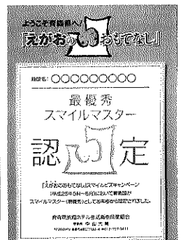
最優秀のいわき旅館(青森市)ほか14施設に授与された