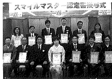
スマイルマスター認定書授与式の様子

次に、おもてなしの心を更に高めようと取り組んだのが「スマイルマスター」認定キャンペーンである(平成26年5月～8月)。宿泊客に各施設の従業員の「笑顔度」(5段階)をアンケート方式で採点してもらい、笑顔度の平均が10点満点中9点以上だった施設を「スマイルマスター」として認定していこうというもの。これには同組合所属の133施設(全255施設)に対し、県内外の観光客から6682枚の応募が寄せられ、14施設が認定された。10月に市内のホテルで行われた認定書授与式の模様はマスコミ各社から報じられ、認定施設の「これからもお客様に喜んでもらえるよう、笑顔で接客をしていきたい」という喜びの声も紹介された。また、缶バッジにはタクシー業界からも申込みがあり、他業界にも影響を与えた取り組みである。