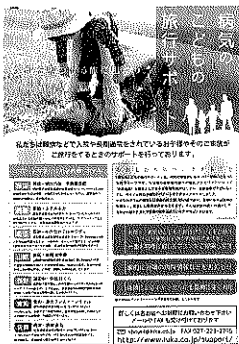
チラシを置いてもらう病院には、直接話をして取り組みの主旨を理解してもらう

「病気の子どもが一緒でも、日常から離れて、“旅”という癒しの場で、家族の絆を深めていただいております」とグループのみなさん。そこでは病気に係わることで様々な思いを持つ家族を笑顔にする、宿泊業だからできる「癒しの旅」を提供している。